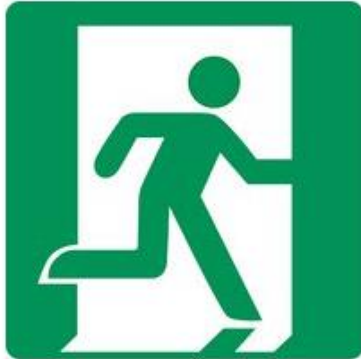
E002 Rettungsweg Notausgang (rechts)