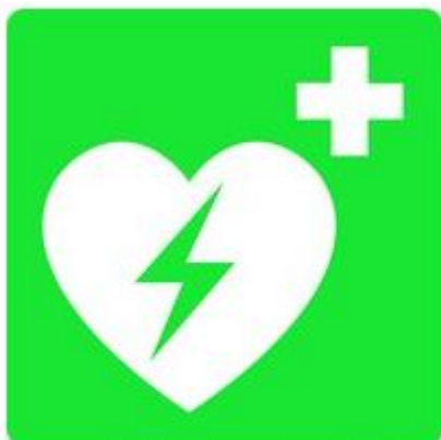
E010 Automatisierter Externer Defibrillator (AED)