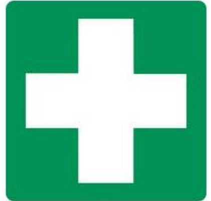
E003 Erste Hilfe