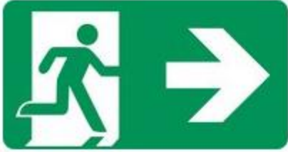
Beispiel für Rettungsweg Notausgang (E0 02) mit Zusatzzeichen (Richtungspfeil) I