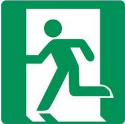
E001 Rettungsweg Notausgang (links)