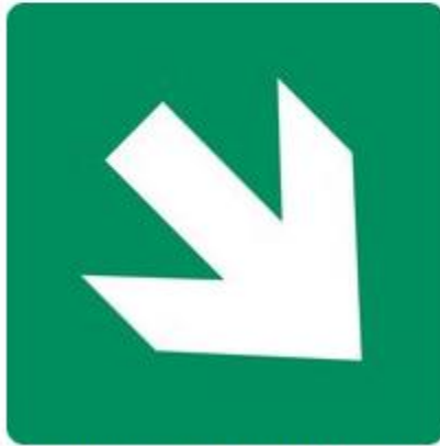
Richtungspfeil Rettung rechts unten