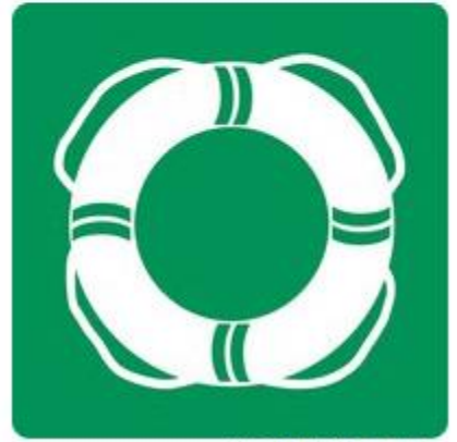
WSE001 Öffentliche Rettungsausrüstung