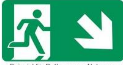
Beispiel für Rettungsweg Notausgang (E0 02) mit Zusatzzeichen (Richtungspfeil) II