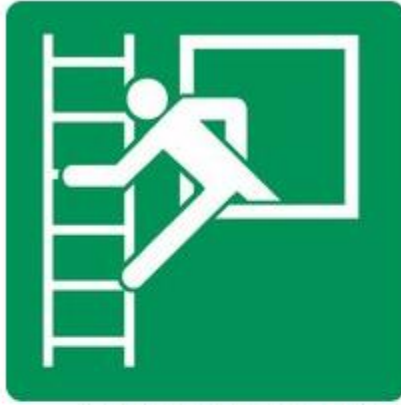
E016 Notausstieg mit Fluchtleiter