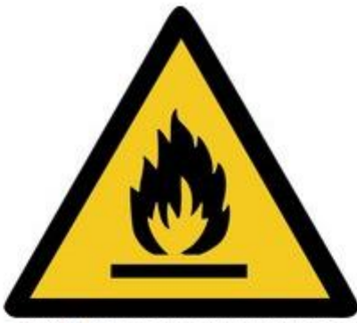
W021 Warnung vor feuergefährlichen