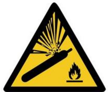
W029 Warnung vor Gasflaschen