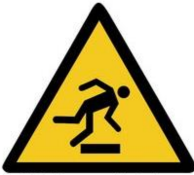
W007 Warnung vor Hindernissen am Boden