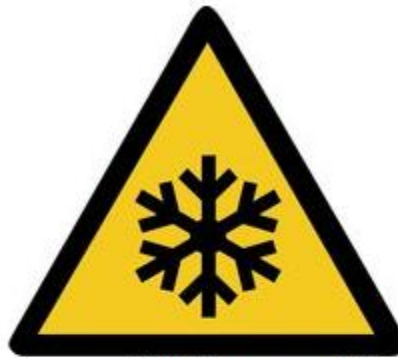
W010 Warnung vor niedriger Temperatur Frost