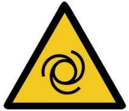
W018 Warnung vor automatischem Anlauf