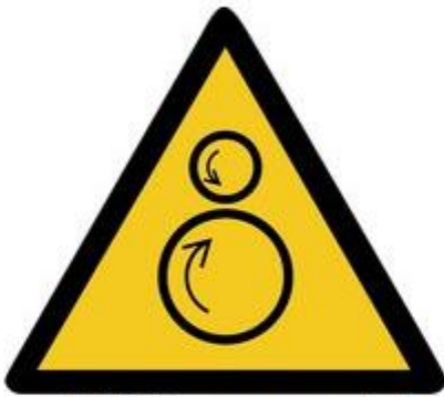
W025 Warnung vor gegenläufigen Rollen