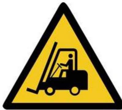
W014 Warnung vor Flurförderzeugen