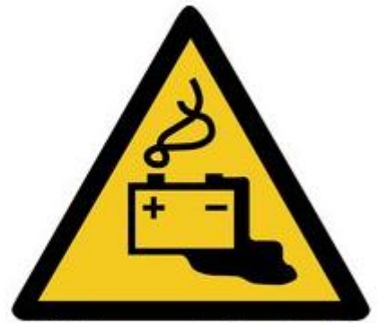
W026 Warnung vor Gefahren durch das Aufladen von Batterien