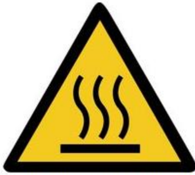
W017 Warnung vor heißer Oberfläche