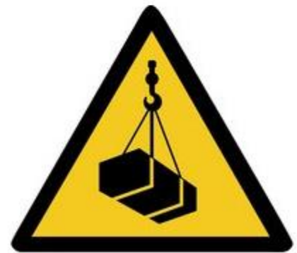
W015 Warnung vor schwebender Last