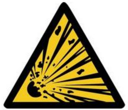
W002 Warnung vor explosionsgefährlichen Stoffen