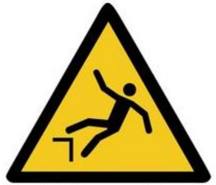
W008 Warnung vor Absturzgefahr