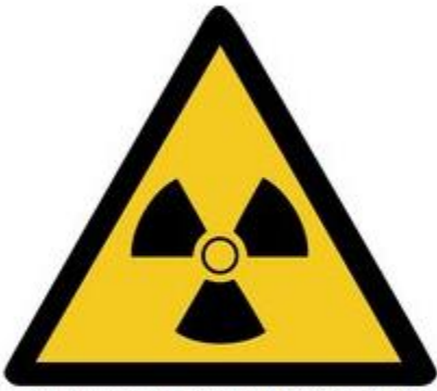
W003 Warnung vor radioaktiven Stoffen