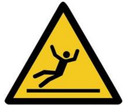
W011 Warnung vor Rutschgefahr