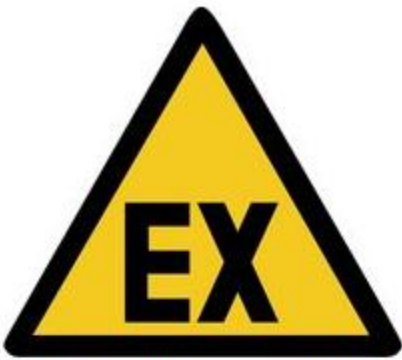
D-W021 Warnung vor explosionsfähiger Atmosphäre