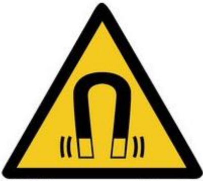
W006 Warnung vor magnetischem Feld