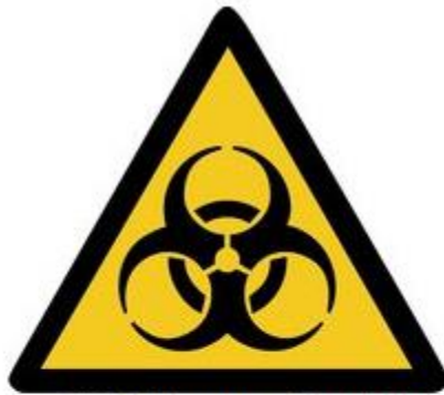
W009 Warnung vor Biogefährdung