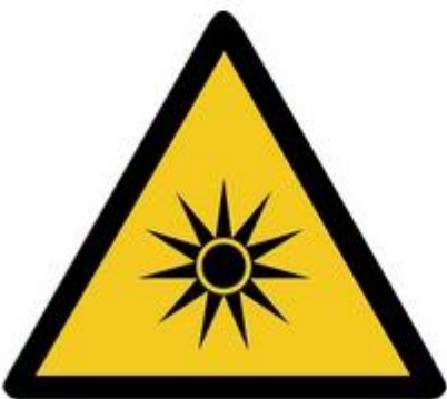
W027 Warnung vor optischer Strahlung