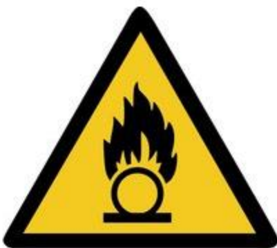
W028 Warnung vor brandfördernden Stoffen