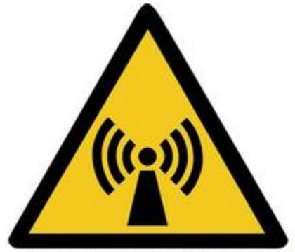
W005 Warnung vor nicht ionisierender Strahlung