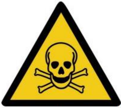
W016 Warnung vor giftigen Stoffen