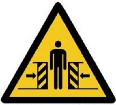
W019 Warnung vor Quetschgefahr