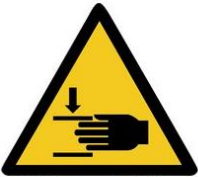
W024 Warnung vor Handverletzungen