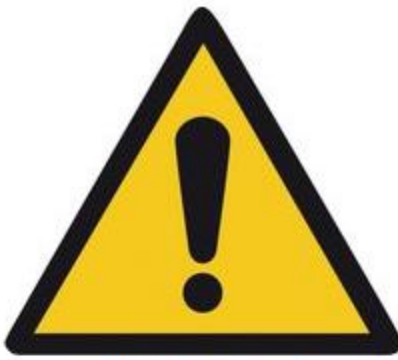
W001 Allgemeines Warnzeichen