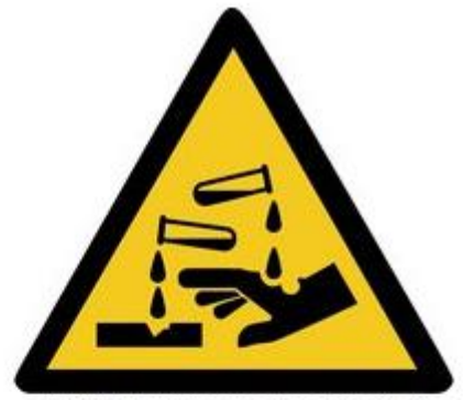
W023 Warnung vor ätzenden Stoffen